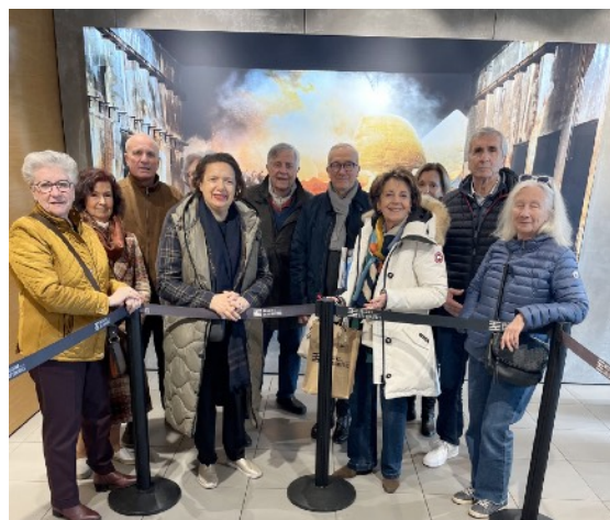
Les Anysetiers à la base sous-marine