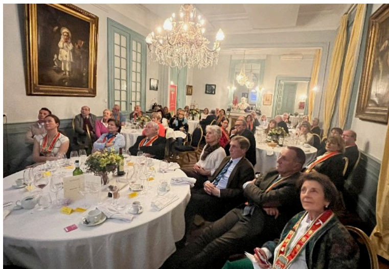
Une assemblée attentive dans les salons de l'ACSO